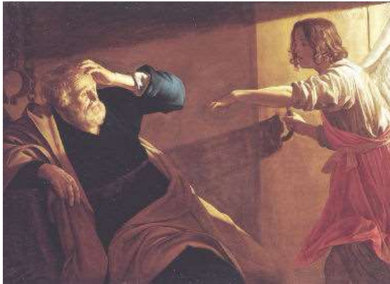
Opera di Gerrit von Honthorst

Questo significa che noi speriamo in tante situazioni umane. Tu ci inviti a sperare in te. Vogliamo lasciar perdere tutti gli appoggi umani e confidare solo in te e nella Comunità.